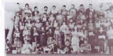
Grupo Ortega y Coro

Que se alabe su nombre para siempre Que su fama perdure como el sol Que El sea bendición de todo el pueblo.