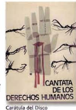
Carátula del Disco