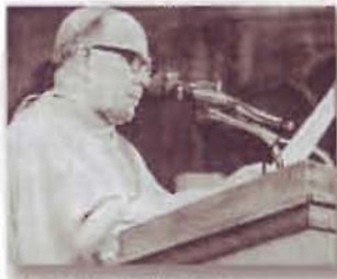
Cardenal Raúl Silva Henríquez