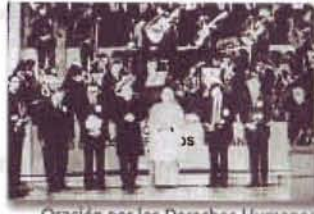
Oración por los Derechos Humanos, Catedral de Santiago 1978

La Ley se ha prosternado ante el más fuerte; Se llenan las prisiones de hombres libres; Y dejan que se quede en la ignorancia El vástago del pobre y del humilde.